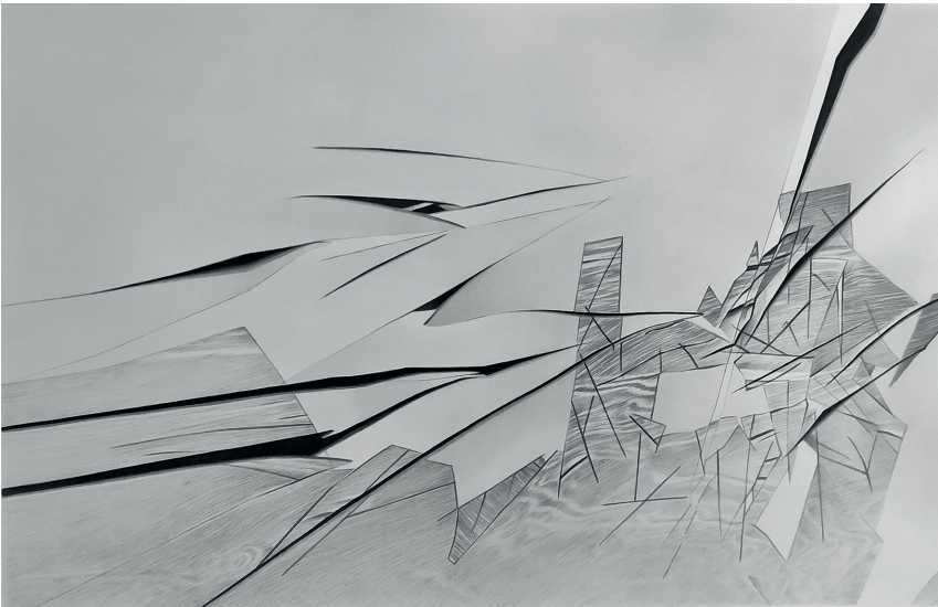
Síntesis paisajística II / tinta china sobre papel / 75 x 105 cms. / 2021