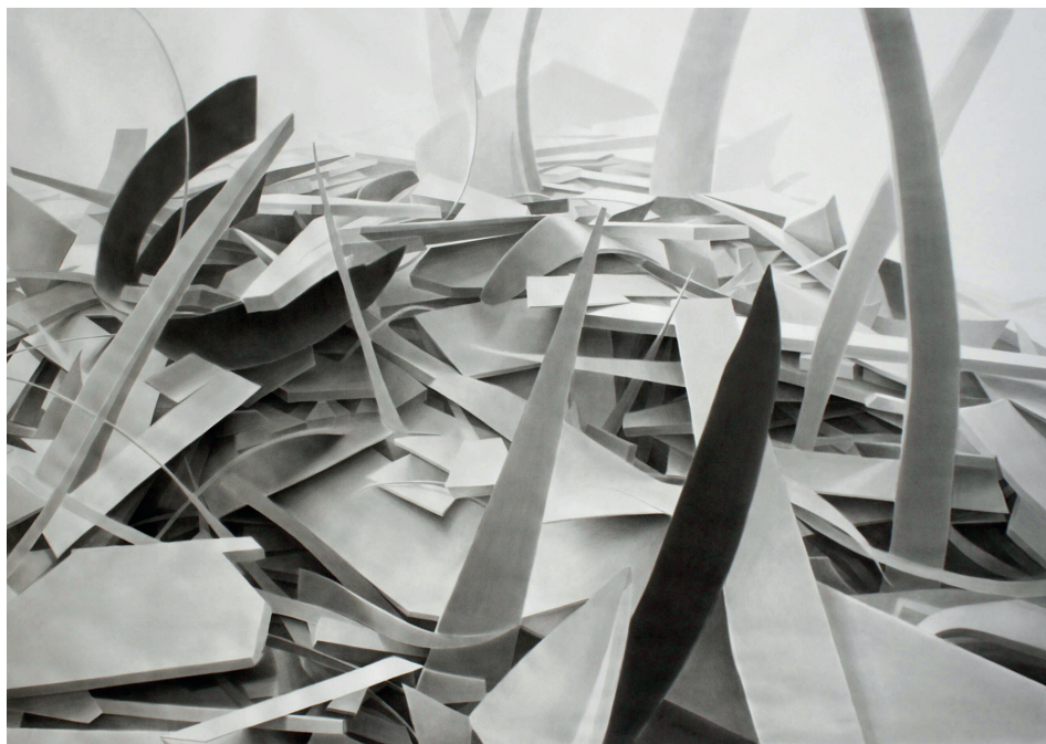
Geometría paisajística / tinta china sobre papel / 140 x 195 cms. / 2017