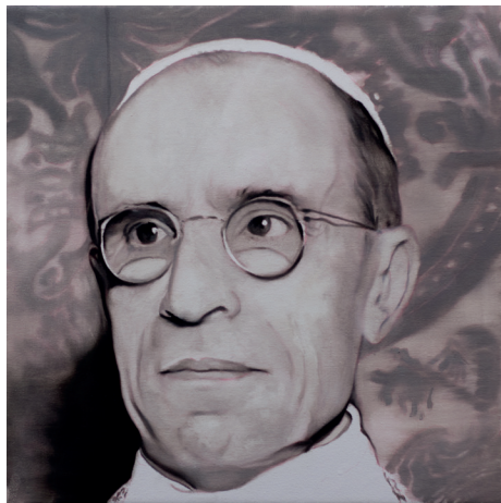
Pollice Verso / óleo sobre tela / 150 x 150 cms. / 2021