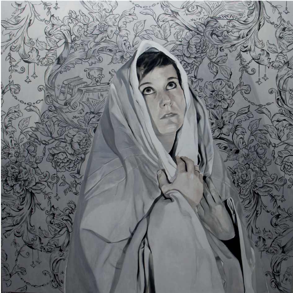
Virgen María / óleo sobre tela / 160 x 160 cms. / 2019