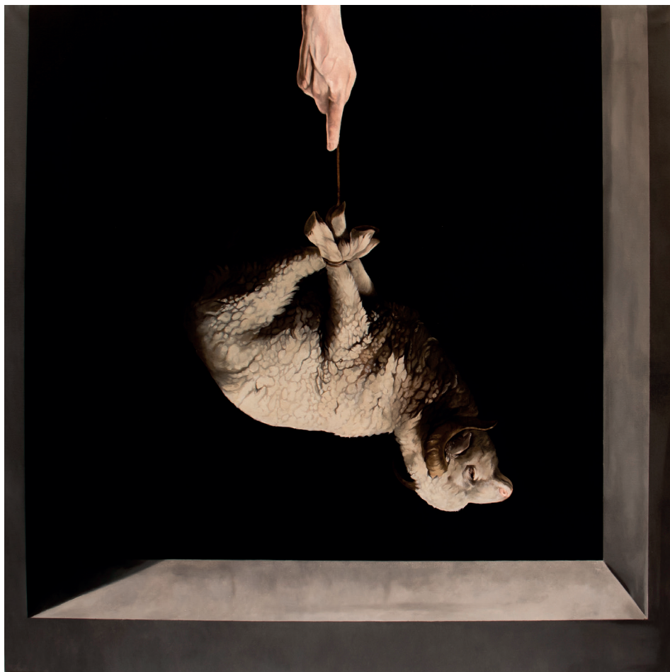
Umbral / óleo sobre tela / 190 x 190 cms. / 2021