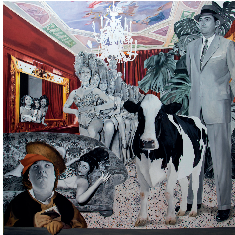
Bakanal / óleo sobre tela / 195 x 195 cms. / 2020