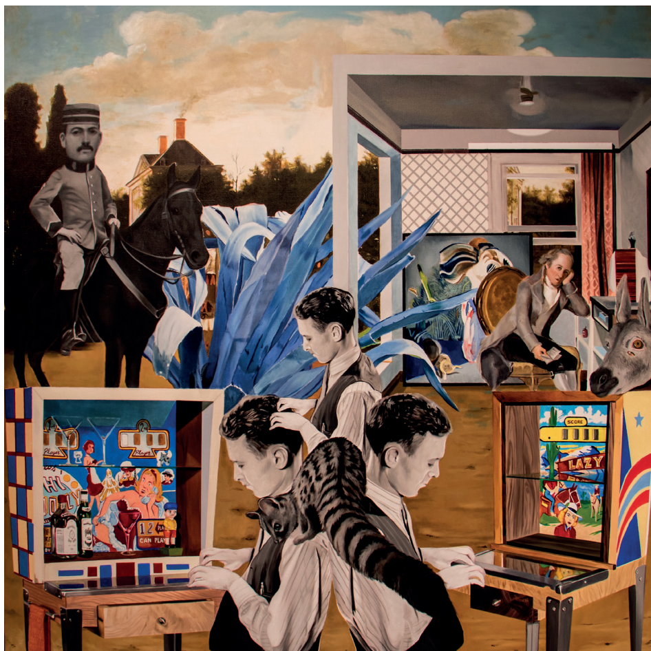
La habitación de Jovellanos / óleo sobre tela / 190 x 190 cms. / 2021