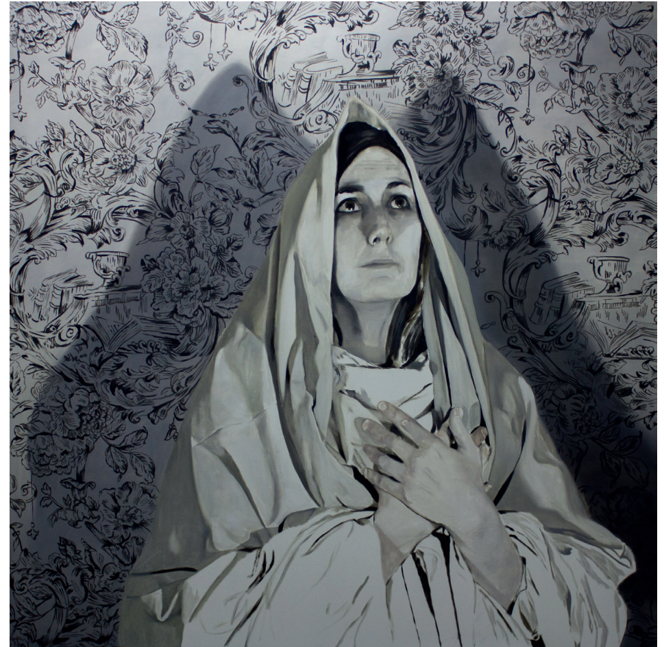
Virgen Belén / óleo sobre tela / 160 x 160 cms. / 2019